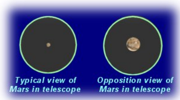
En el recuadro se muestra la típica imagen de Marte vista a través de un telescopio y su vista en oposición.

2. ¿Qué tan diferente será el aspecto del cielo? Por lo general, Marte parece un pequeño punto anaranjado en el cielo; este verano y otoño parecerá un punto anaranjado mayor en el cielo: se habrá convertido en la cosa más brillante de la constelación Aquarius. A pesar de que mantiene el mismo tamaño, se ve más grande a través de un telescopio porque está más cerca. Siga el vínculo indicado más adelante para obtener ayuda de cómo observar Marte. Si usted quiere hacer de anfitrión para una observación de Marte, primero podría ser de provecho que sus estudiantes vuelven a hacer la actividad "Recuerda el Huevo". ( http://www.astrosociety.org/education/publications/tnl/egg.html ). Esto les ayudará a perfeccionar sus habilidades de observación y los entrenará para que noten los detalles sutiles en Marte ya que éstos serán los únicos que pueden verse debido a los efectos borrosos de nuestra atmósfera.